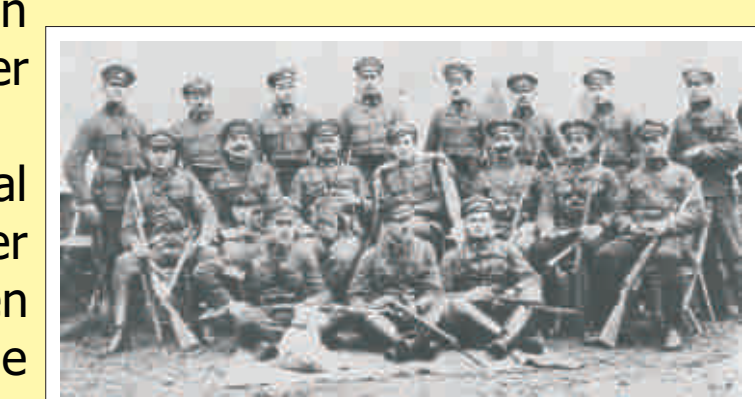
Gendarmerie-Abteilung des Posten Güssing 1923 - die Gendarmerie war die erste österreichische Einheit auf dem Gebiet des Burgenlandes

Im Laufe der nächsten Jahre wurde die Politik und die Interalliierte Grenzkommission des Völkerbundes aktiv. Die Stimmung in den Gemeinden selbst war noch alles andere als geschlossen. Da der natürliche Absatzmarkt für die Bildeiner Bauern und Fuhrlente Steinamanger (Szombathely) war, tendierten diese in Befragungen und in einem Schreiben an die Grenzkommission erst eher zum Verbleib bei Ungarn. In der deutschsprachigen Nachbargemeinde Pernau (Pornóapáti), keine zwei Kilometer von Bildein entfernt, wurde die Grenzkommission hingegen mit einem "Hoch Österreich"-Transparent empfangen. Ende 1922 entschied der