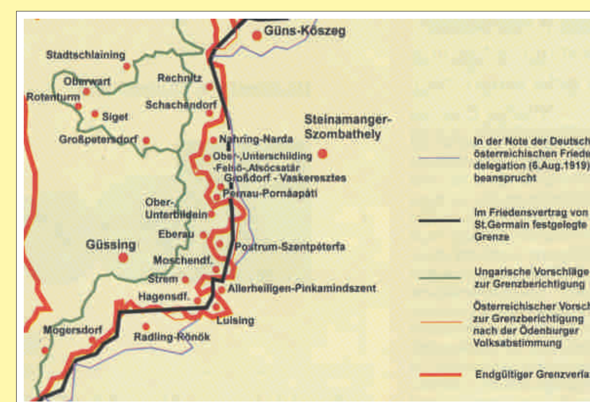
Die verschiedenen territorialen Forderungen der Staaten im Südburgenland vor und nach dem Friedensvertrag von St. Germain

Bei der Friedenskonferenz in Paris - St. Germain ab Mai 1919 forderte die österreichische Delegation vehement den Anschluss der westungarischen Gebiete, vorerst wollten die Siegermächte die Grenzen aber nicht verrücken. Erst nach Protesten wurde in einer zweiten Version des Friedensvertrages Deutsch-Westungarn Österreich zugesprochen. Die Gebietsforderungen der österreichischen Regierung wurden in diesem Vorschlag jedoch nicht in vollem Umfang berücksichtigt. Güns (Kőszeg) zum Beispiel sollte bei Ungarn bleiben, Ödenburg (Sopron) samt Umland wurde aber an Österreich angeschlossen, wie auch die Gemeinden des unteren Stremtales. Nur das kleine, abgelegene, deutschsprachige Straßendorf Luising zwischen Strembach und Pinka im westlichen Zipfel des Bezirk