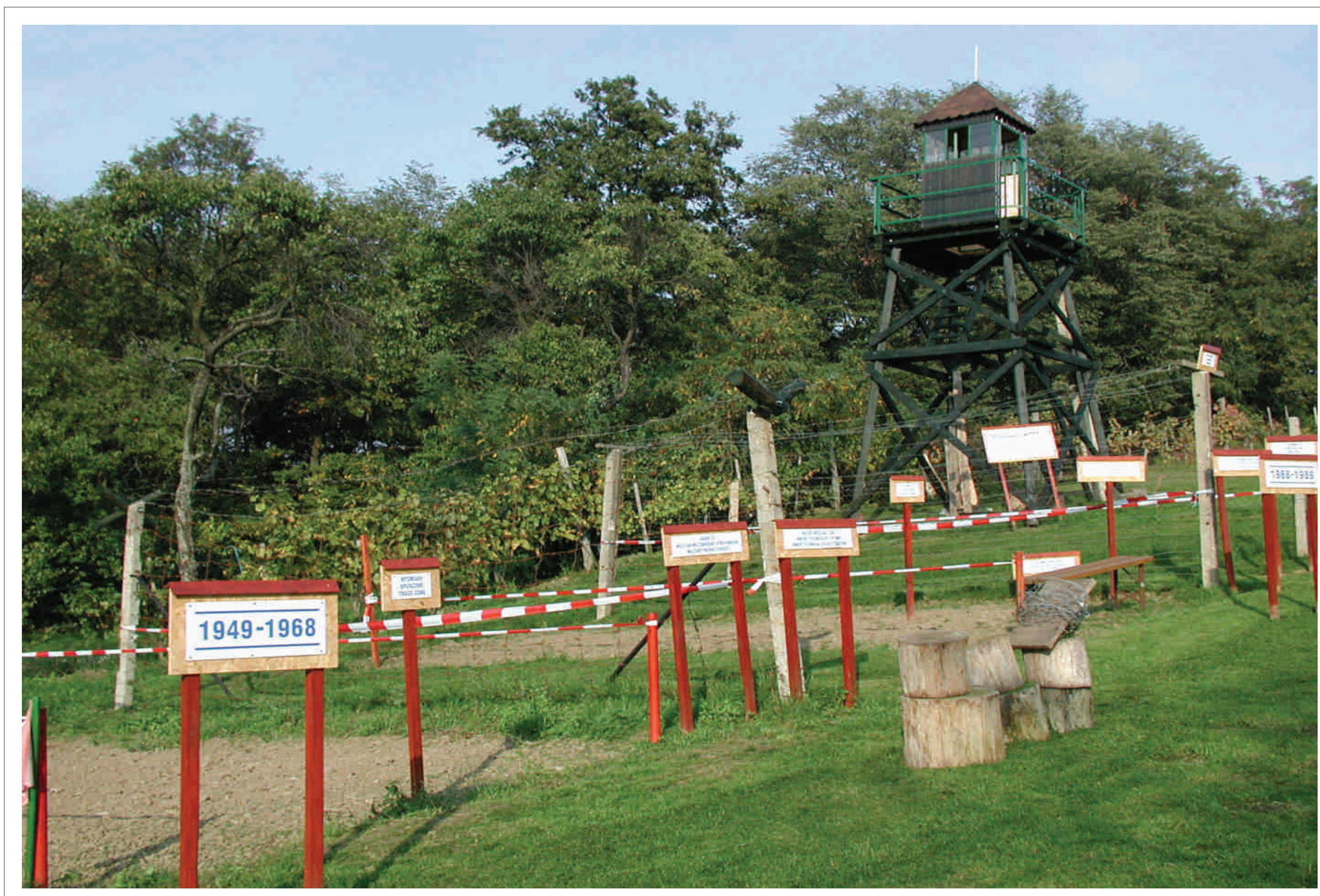
Nachbauten der verschiedenen Bauweisen des "Eisernen Vorhanges", zu sehen am ungarischen Eisenberg bei Vaskeresztes (Großdorf)