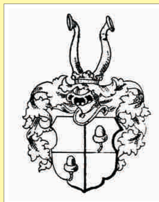
Das Wappen der Ellerbach

Eine eigenständige Pfarre wird Eberau erst 1489, zuvor ist der Ort der Pfarre Pernau zugehörig.