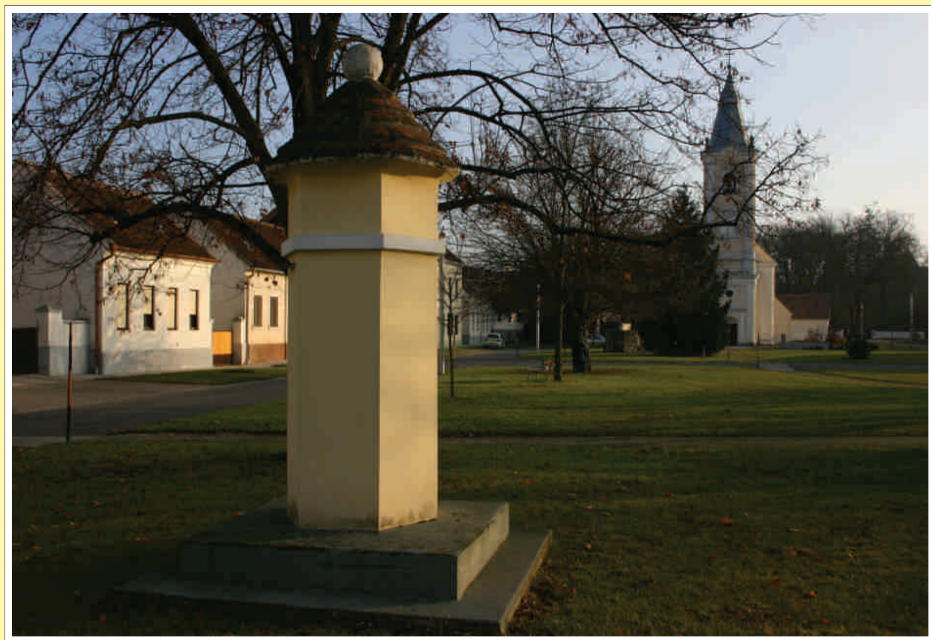
Der Pranger am Anger