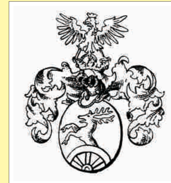
Das Wappen der Fam. Erdődy

Ende des 15. Jahrhunderts endet die Zeit der Ellerbach in Eberau und Herrschaft und Burg fallen an die Familie Erdődy. Aber schon 1557 tauschen die Erdődy ihren Besitz gegen das in Kroatien liegende Gut des Grafen Zrínyi, dessen Nachkommen bis 1613 in Eberau bleiben. 1587 bis 1591 befand sich auch eine Druckerei des Manlius im Schloss. 1613 kam die Herrschaft wieder an die Familie Erdődy, in deren Besitz das Schloss Eberau noch heute ist. Dieses Schloss hat später durch wesentliche Umbauten der Erdődy in der Mitte des 17. Jahrhundert Renaissancecharakter angenommen.