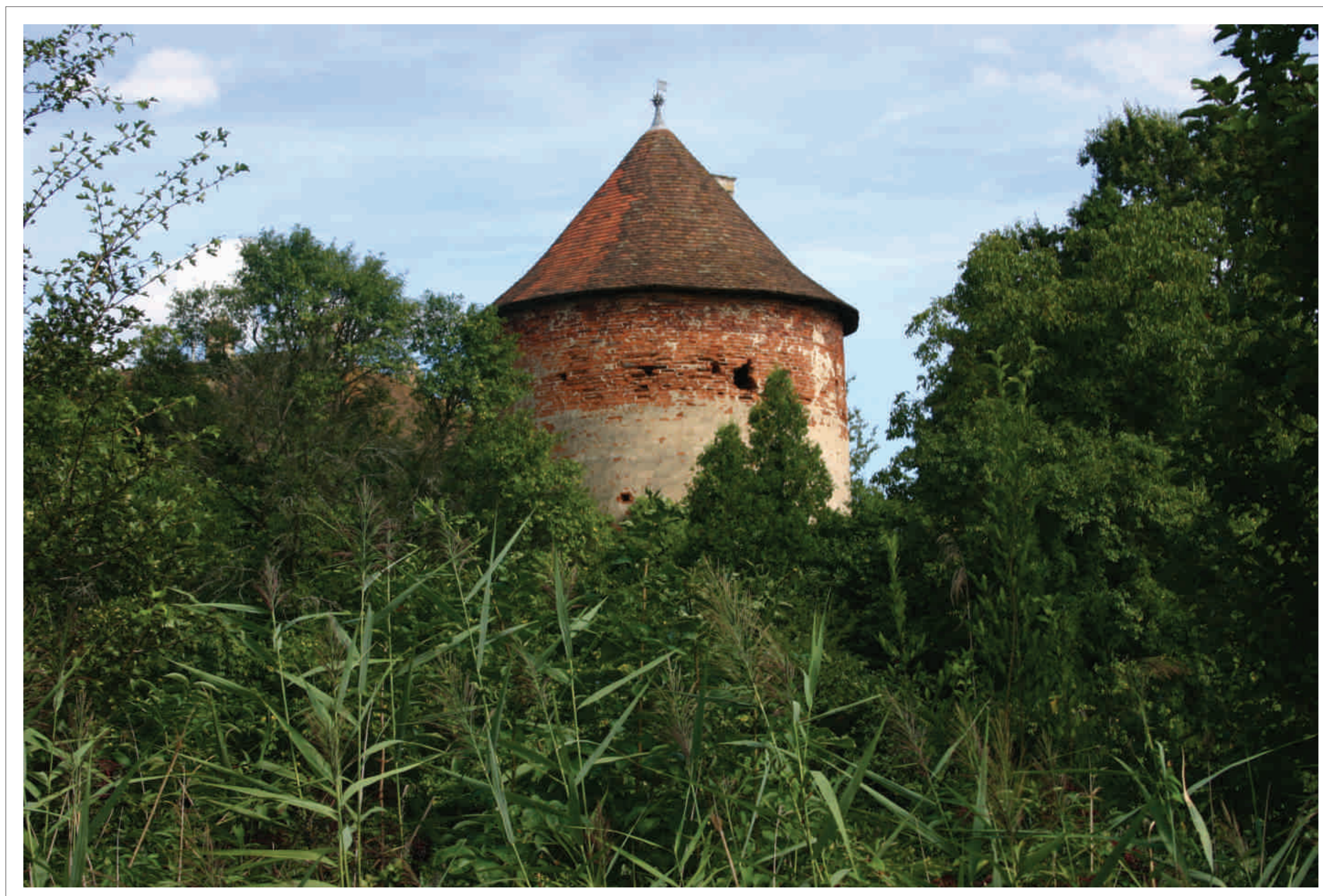
Der Pulverturm - ein erhaltener Teil der mittelalterlichen Befestigungsanlage