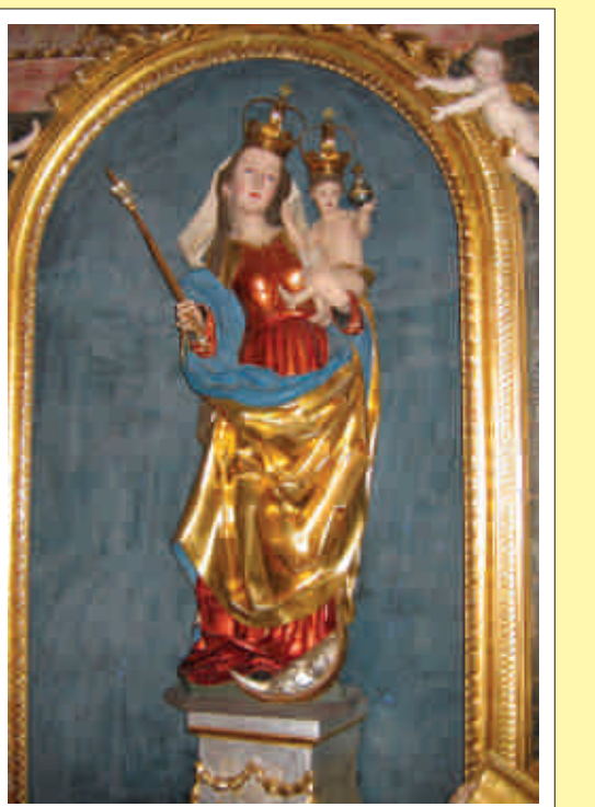
Die Gnadenstatue im Sanktuarium

Beachtung finden sollte auch das schöne schmiedeiserne Kreuz aus dem 18. Jahrhundert neben dem Karner.