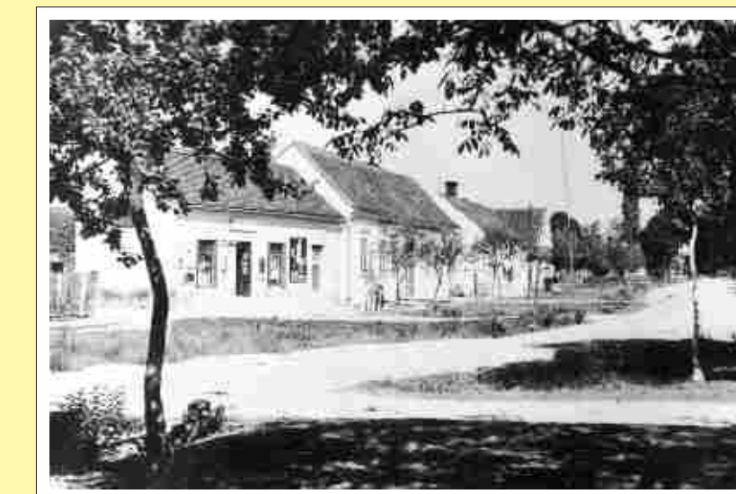
Der Anger von Moschendorf 1927

Das Angerdorf ist die planmäßigste ländliche Dorfanlage. Der Dorfanger, eine mitunter sehr weite, oft baumbestandene Grünfläche zwischen den Häuserzeilen in Gemeinschaftsbesitz, wurde früher als Viehweide, Holzlagerplatz oder Marktort verwendet. In späteren Zeiten wurde der Anger vielfach verbaut, oder ist nur noch in Resten vorhanden (so auch in Güssing). Das Angerdorf ist gerade im Burgenland überaus häufig anzutreffen und kommt in mehreren Varianten vor, die sich durch die Form des Angers unterscheiden: Moschendorf, wo Sie sich zur Zeit befinden, und auch Steinfurt sind schön erhaltene Beispiele für einen linsenförmigen Anger. Strem, Bildein und Eisenberg haben einen Dreiecksanger, während Deutsch Schützen, Urbersdorf, Gaas und Kulm über einen Schmalanger und Dt. Ehrendorf über einen Breitanger verfügen.