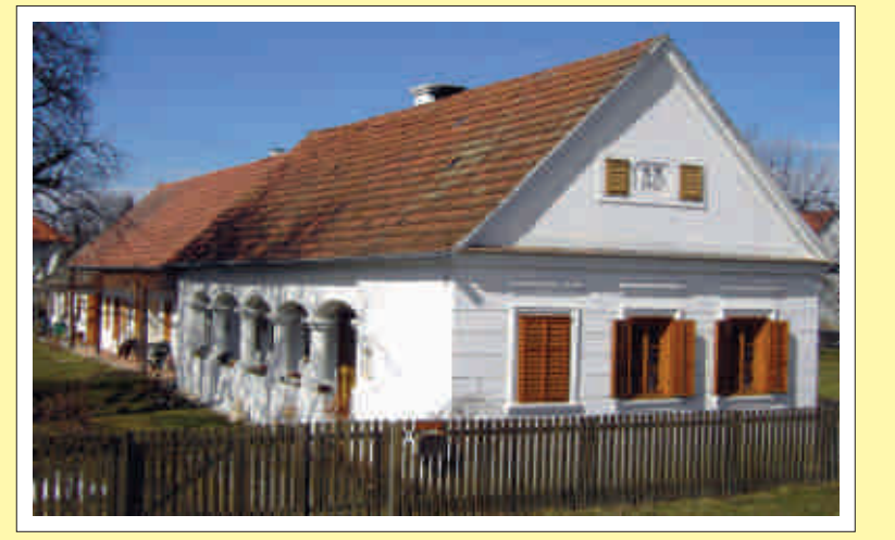
Beispiel für einen Streckhof in Moschendorf

Auch bei den Gehöftformen gibt es wie schon bei den Flur- und Dorfformen viele Gemeinsamkeiten mit den benachbarten Bundesländern und den ungarischen Nachbarn. Es geht dabei um die Stellung der für die Bauernwirtschaft notwendigen Bauten auf der Hofparzelle. Danach werden die Hofformen unterschieden. Grundsätzlich gab es ursprünglich in den Dörfern nur ebenerdige Kleingehöfte bäuerlicher Prägung. Beim Streckhof, der für den Naturpark in der Weinidylle gewissermaßen charakteristisch ist, steht das Wohnhaus mit drei Fenstern giebelseitig zur Straße, während dahinter eine Kammer, der Stall und die Scheune unter einem einheitlichen Dach folgen. Ursprünglich waren die Bauten lehmverstrichene Holzblockbauten und oft kann man entlang des Hauses einen für das Südburgenland typischen idyllischen Arkadengang sehen. Beim Hakenhof ist die Scheune quer hinter den Ställen angeordnet und schließt den Wirtschaftshof nach hinten ab. Typisch für den burgenländischen Raum sind die Laubgänge entlang des Hauptgebäudes, die mit meist malerischen Arkaden zum Wirtschaftshof hin abschließen. Sie ahmen damit wohl die herrschaftlichen Schlösser nach. Aber auch die Hinteransicht der Ortschaften mit ihren hölzernen Stadlfrenten in Blockwerkbauweise, wie sie gerade in Moschendorf noch sehr gut erhalten ist, war typisch und landschaftsprägend und ist sehr bemerkenswert.