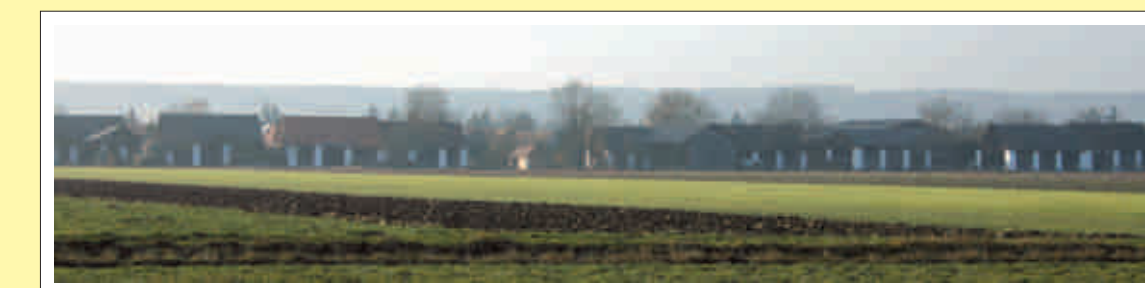
Stadtleile der Ortschaft Moschendorf

Außerhalb der Ortschaften, an den Hängen der Weinberge, liegen oft auch die unbewohnten Kellerdörfer mit einigen noch erhaltenen lehmverstrichenen Blockbauten mit Strohdach (v.a. im Kellerviertel Heiligenbrunn), die für den Weinbau notwendig und für unseren Raum typisch sind.