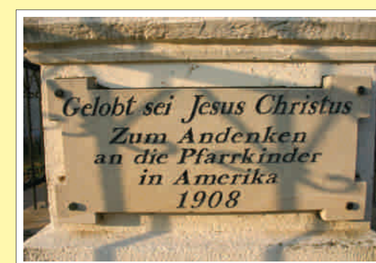
Aufschrift eines „Amerikanerkreuzes“ in Eberau

Der Pinkaboden ist das Gebiet, aus dem prozentuell die meisten Burgenländer nach Amerika gezogen sind. Die Auswanderungswelle begann hier im großen Maßstab erst um die Jahrhundertwende. Aus Moschendorf und Deutsch Schützen sind mehr als 300 Personen ausgewandert, was diese beiden Gemeinden zu den bedeutendsten Auswanderergemeinden des ganzen Burgenlandes macht. Die Auswanderung aus Unterbildein bewirkte einen Bevölkerungsrückgang von 407 Einwohnern im Jahre 1910 auf 301 im Jahre 1934. In Eberau sank die Bevölkerungszahl im selben Zeitabschnitt von 550 auf 430.