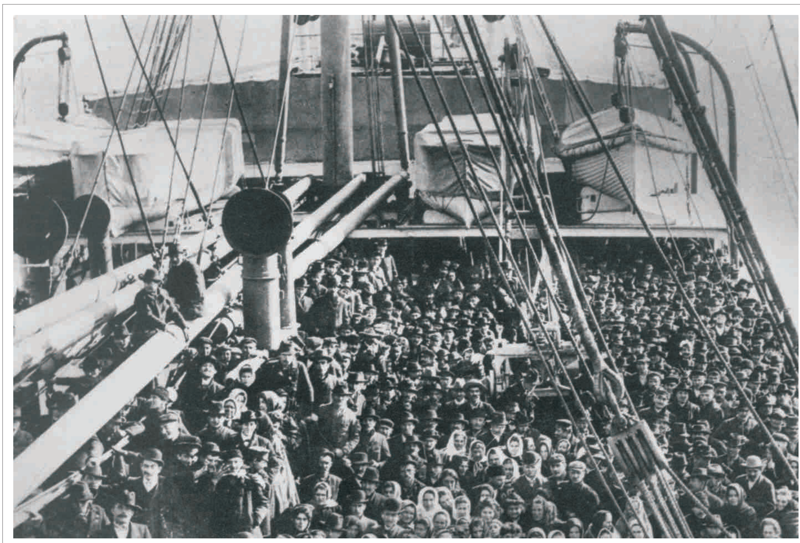
Auf einem Auswandererschiff nach Amerika