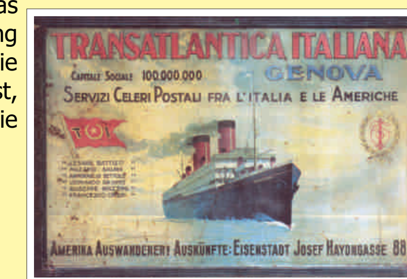
Werbeplakat einer Auswanderer-Schiffahrtlinie

Es waren aber nicht nur ökonomische Gründe, die viele veranlasste wegzugehen. Das Burgenland war über Jahrhunderte Grenzregion und die vorwiegend bäuerliche Bevölkerung hatte viel zu erleiden. Die geringen Aussichten auf Aufstieg und Besserung der Situation, die Frustration über die noch immer reiche Grundherrschaft, verknüpft mit einem offenen Geist, der den Burgenländern aufgrund der Lage zwischen den beiden Reichshälften der Monarchie eigen war, trugen gleichfalls zur großen Abwanderungsbewegung bei.