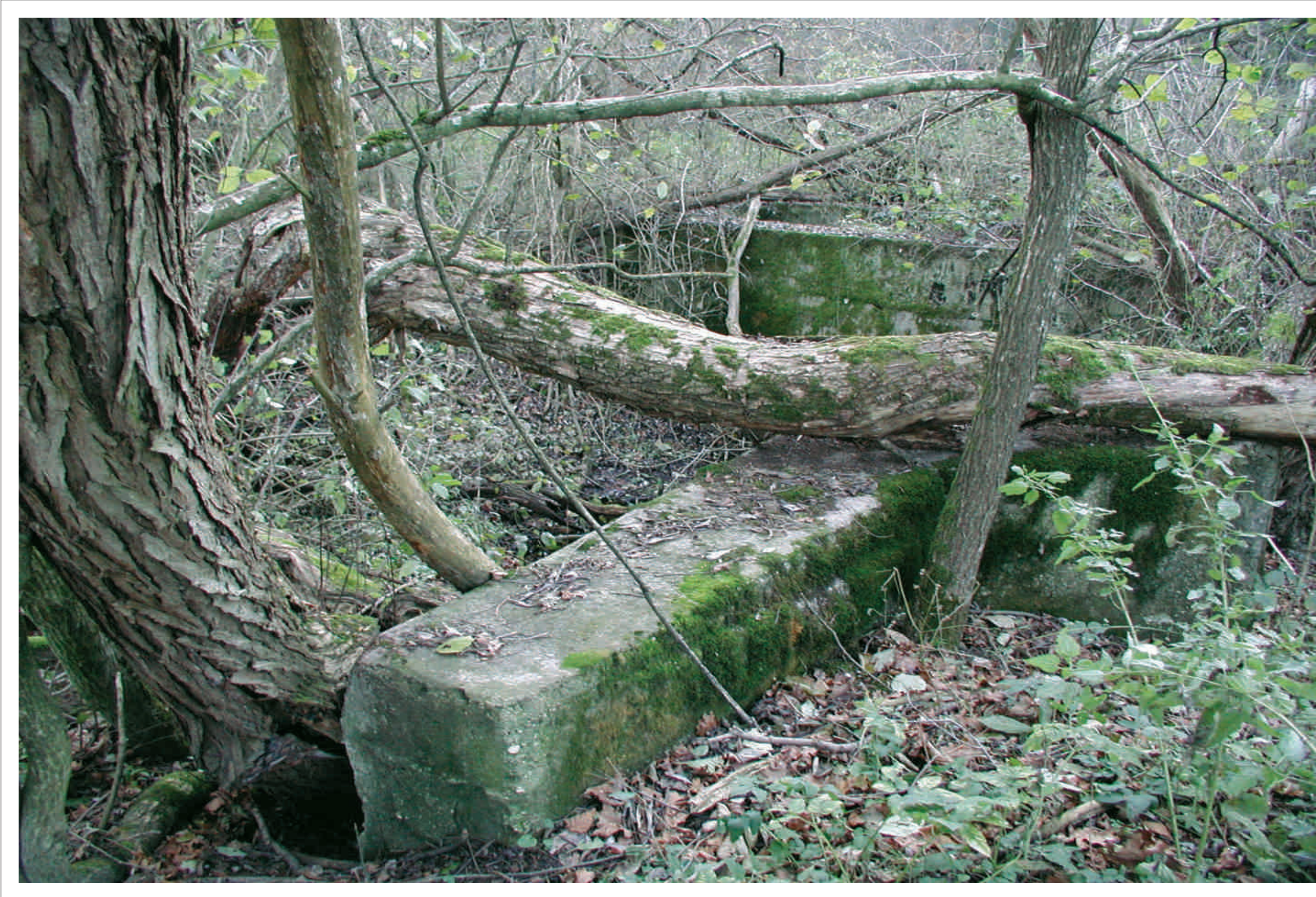
Die heute noch sichtbaren Reste eines Wehres bei Ungarisch Bieling jenseits der heutigen Grenze