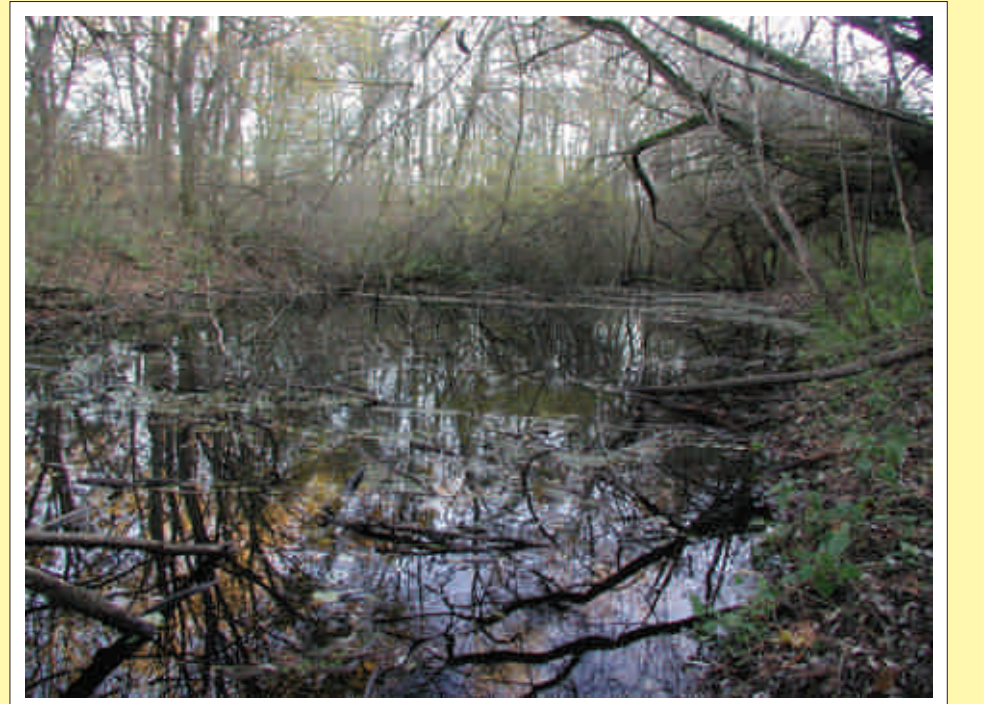
Der ehemalige Mühlendampf von Ungarisch Bieling, wie er sich heute darbietet.

Die Mühle war ein Problem, da die Grenze genau an ihr vorbeiführte. Doch hierfür gab es eine friedliche Lösung. Die Österreicher durften auch weiterhin ihr Getreide zur Mühle bringen. Besaß man einen Pferdepass, konnte man auch die letzten Meter auf ungarischem Boden fahren. Wenn nicht, wurde das Getreide das letzte Stück getragen, oder der Müller holte es selbst von der Grenze ab. Doch einige Zeit nach dem Anschluss wurde die Mühle aufgelöst, da der Staat Anspruch auf das Wasserrecht erhob. Der Mühlenbesitzer bekam eine entsprechende Abfertigung und siedelte sich andernorts an.