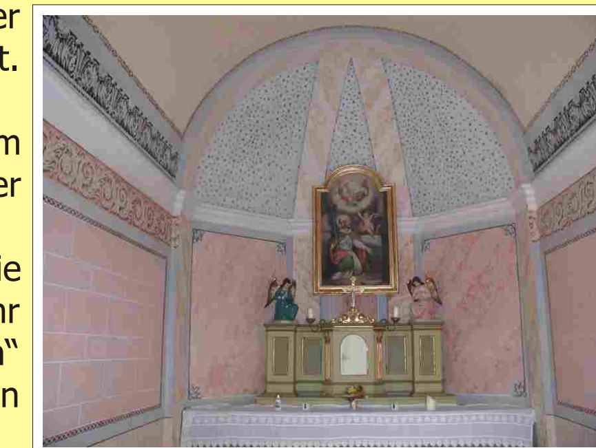
Das Innere der Ulrichskapelle

Es gibt in Österreich keine zweite Kirchen, die dem hl. Klemens geweiht ist. Im ungarischen Bük befindet sich der nächstgelegene Sakralbau, der unter seiner Schirmherrschaft steht. Im Zusammenhang mit der Besiedelung des Gebietes aus Bayern kam offenbar die Verehrung des hl. Ulrich, Bischof von Augsburg, ins Südburgenland. Ulrich wurde im Jahr 993 heilig gesprochen. Ihm sind im süddeutschen Raum viele „Quellen“ und „Brunner“ geweiht. So blieb der hl. Klemens der Patron der Kirche, die Kapelle mit der heiligen Quelle weihte man dem hl. Ulrich.