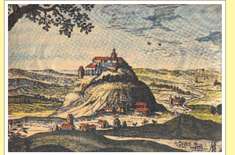
Stich aus Ortelius Redivivus, 1665

Heute kann man im Burgmuseum auf der Burg verschiedene historische Ausstellungen (unter anderem mit Bildern von Lucas Cranach) und die sehenswerte Burgkapelle besichtigen. Der Turm bietet einen Panoramablick bis tief nach Ungarn.